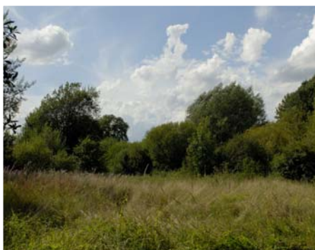
Blick in unser SchGB (10.) „Am Weghaus“