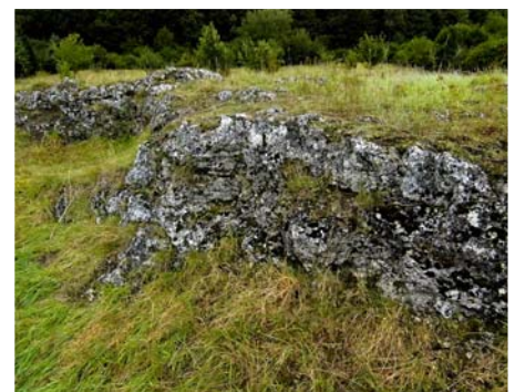
Naturdenkmal „Duckstein“ in unserem SchGB (13.) „Dreisch“