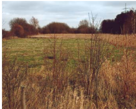
Blick in unser SchGB (1.) „Rottebach“