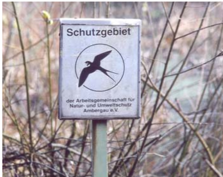
Mit diesen Schildern sind unsere Schutzgebiete gekennzeichnet