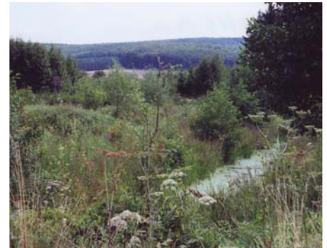
Blick in unser SchGB (4.) „Wehrstedt an der Lamme“