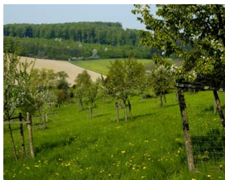
Blick in unser SchGB (13.) „Dreisch“